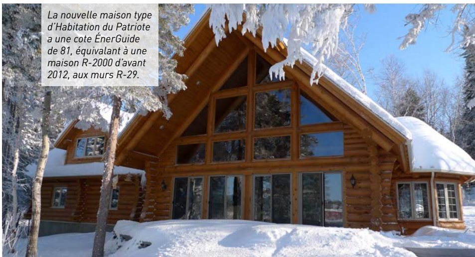
La nouvelle maison type d'Habitation du Patriote a une cote ÉnerGuide de 81, équivalent à une maison R-2000 d'avant 2012, aux murs R-29.